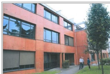
TCE – GV'Etudes – TOD Ingénierie

- Economie – Structure – Fluides • Montant : 4 M€