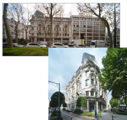
TCE – GV'Etudes – TOD Ingénierie

- Economie – Structure – Fluides • Montant : 1 M€