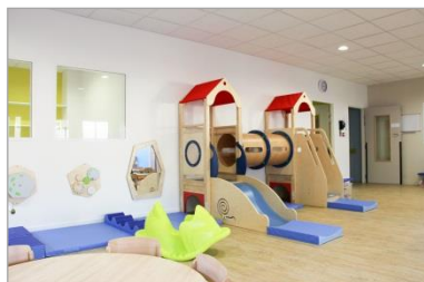
GV'ETUDES, TOD Ingénierie