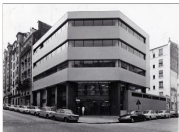
TCE – GV'Etudes – TOD Ingénierie