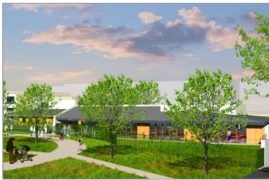
TCE – GV'études – TOD Ingénierie