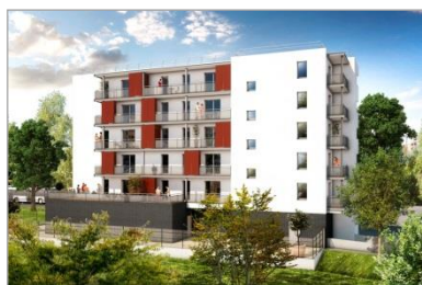
TCE – GV'études – TOD Ingénierie