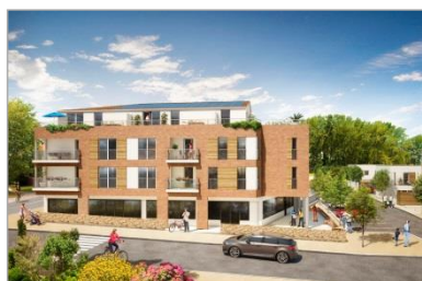
TCE – GV'études – TOD Ingénierie

- Economie de la construction – Structure – Fluides • Montant : 10,5 M€