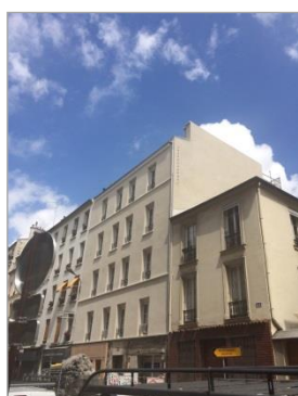
TCE – GV'études – TOD Ingénierie

- Economie – Structure – Fluides • Montant : 2,24 M€