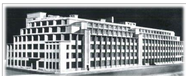
TCE – GV'Etudes – TOD Ingénierie