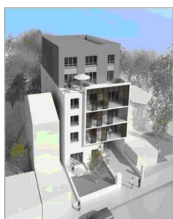
TCE – GV'études – TOD Ingénierie

- Economie – Structure – Fluides • Montant : 10,5 M€