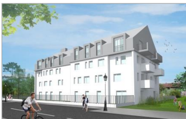
TCE – GV'études – TOD Ingénierie

- Economie de la construction • Montant : 5,7 M€