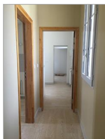
TCE – GV'Etudes – TOD Ingénierie

- Economie – Fluides • Montant : 1,55 M€