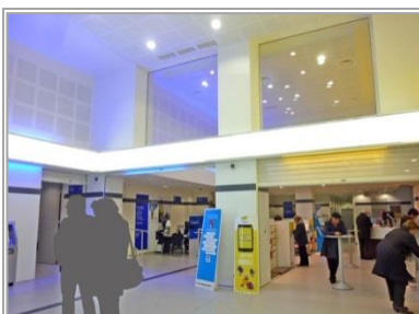
TCE – GV'Etudes – TOD Ingénierie

- Economie – Structure - Lots techniques CVC, électricité • Montant : 9 Me