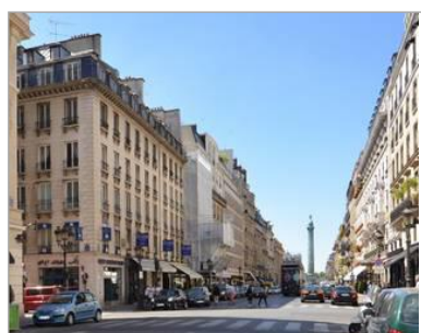
TCE – GV'Etudes – TOD Ingénierie

- Economie – Structure – Fluides • Montant : 11 M€