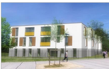
TCE – GV'études – TOD Ingénierie

- Economie de la construction – Structure - Fluides • Montant : 12,9 M€