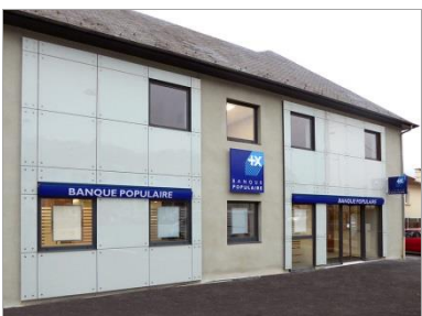
GV'ETUDES, TOD Ingénierie