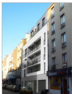
TCE – GV'études – TOD Ingénierie